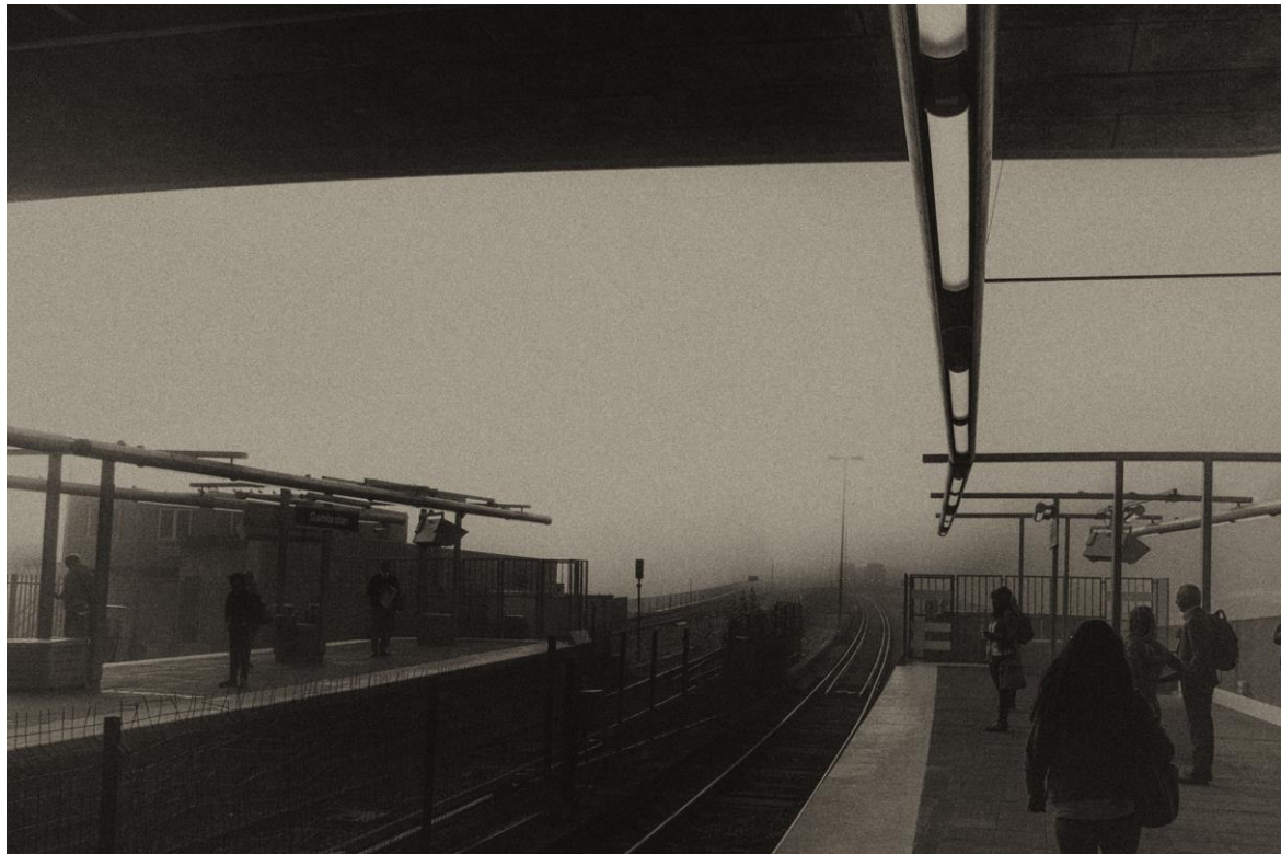
Vy mot Slussens

Mötet den 3 februari, vi diskuterade känslor, pratade om beskärning, visade olika sätt att föra fram ett budskap, hörde beska kommentarer, roliga påpekanden och allvarliga diskussioner om vad som gör att jag som betraktare tycker om eller förkastar en bild. Varför – berör – vissa bilder mer än andra. Fredriks bild från Gamla Stans T-bana blev en av de mest diskuterade och dessutom väldigt omtyckt med sin ”dystra”, ”trista”, ”muggiga” ton och med sin ”äkta novemberkänsla”.