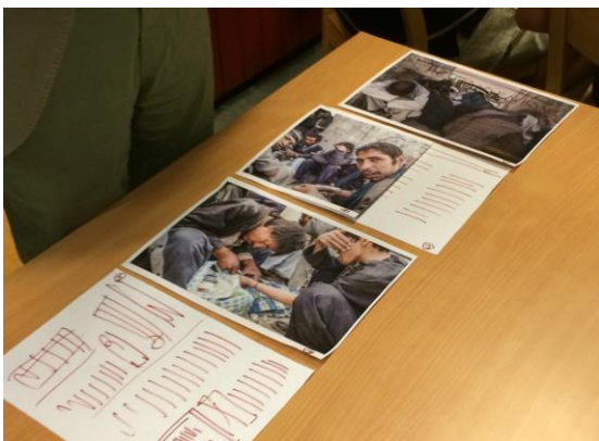
Ett av alla grupparbeten

Det blev en spännande och intensiv "workshop" alldeles innan sommaren slog till och vi alla gick in i årets semesterkänsla.