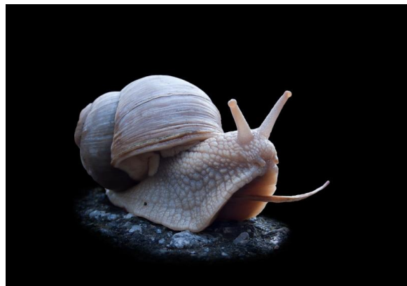
P-G Johansson – Draksnigel

De fem bilder som valts ut till fotomässan att visas parallellt med fotografierna i Gatufotogruppen är: