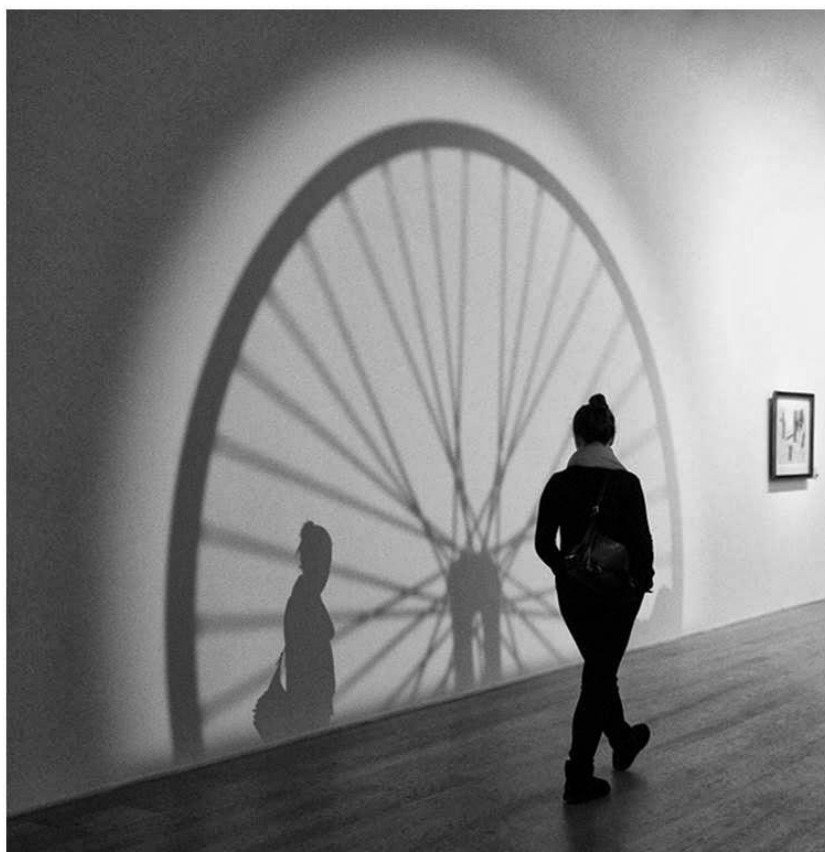
Skugga – Fotograf: Irina Johansson mottog första plats i den Fria klassen

I den FRIA klassen fick IRINA JOHANSSON första plats med bilden ”Skugga”.