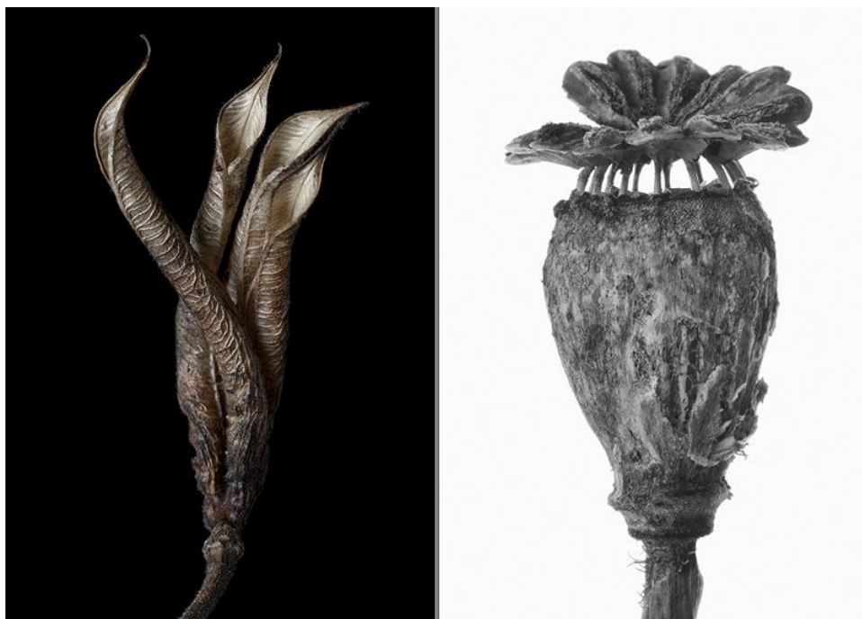
Kärlekens frukter, Akleja och vallmo, Edvard Koinberg

Edvard Koinberg bor och arbetar i Stockholm. Han berättar: