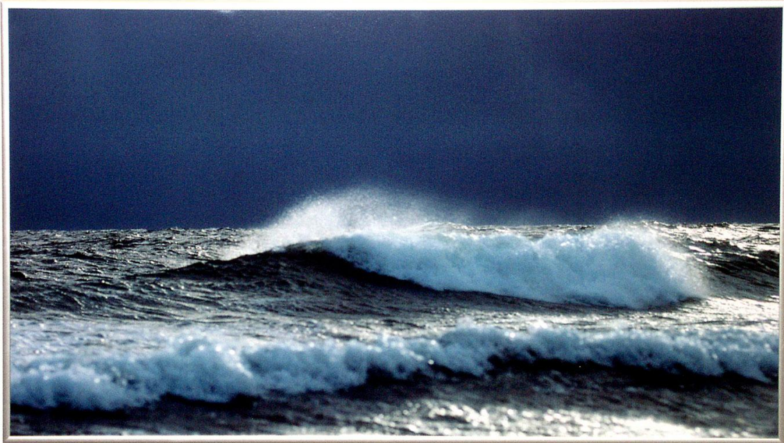
Bakom varje våg döljer sig en ny värld.