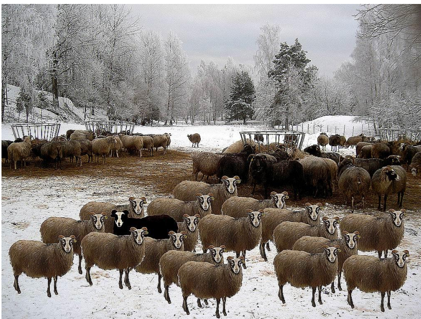
Får, 2007.